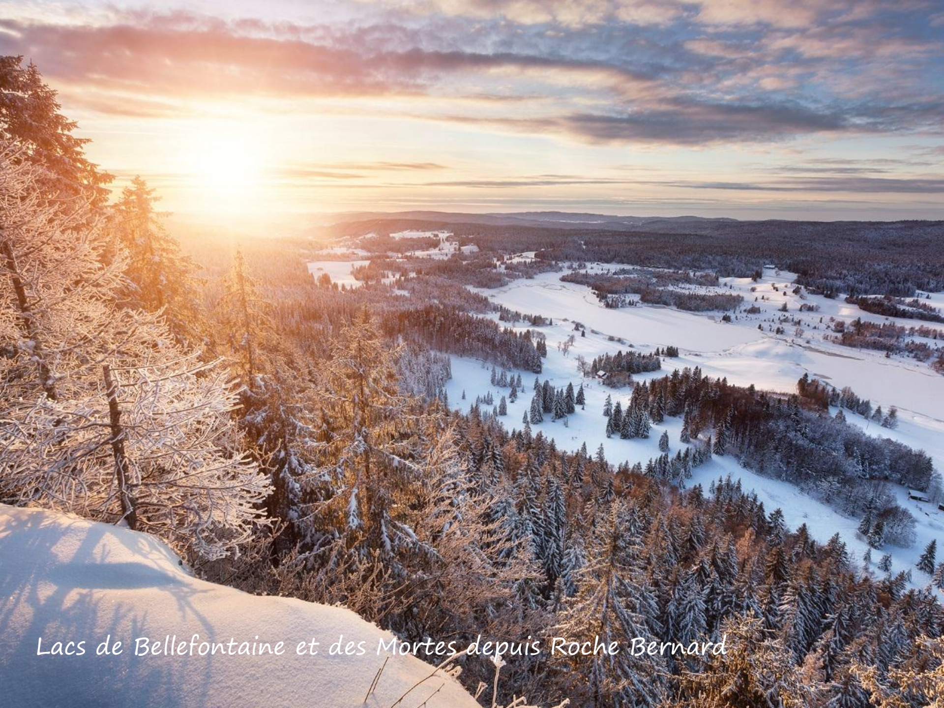
Lacs de Bellefontaine et des Mortes depuis Roche Bernard