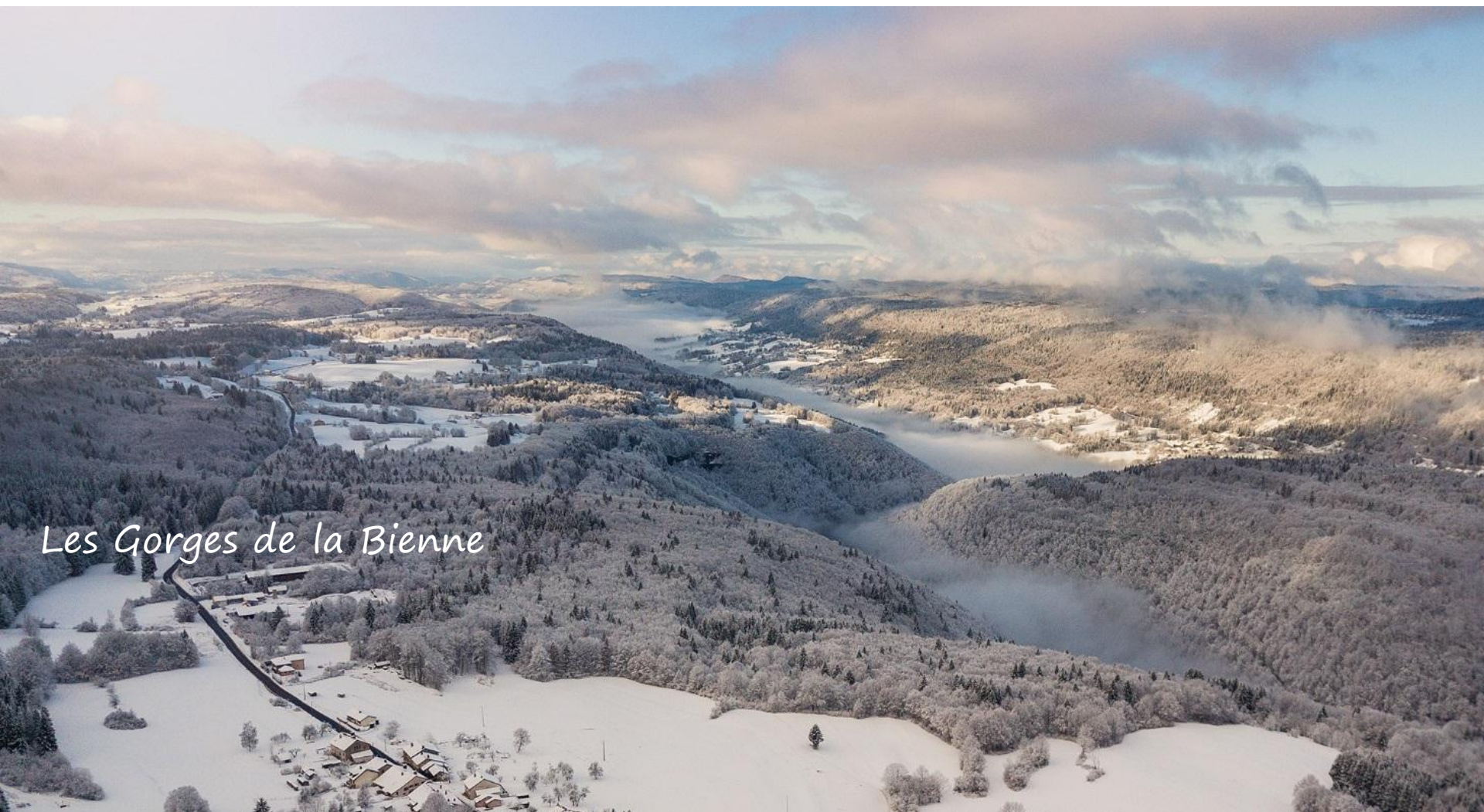
Les Gorges de la Bienne